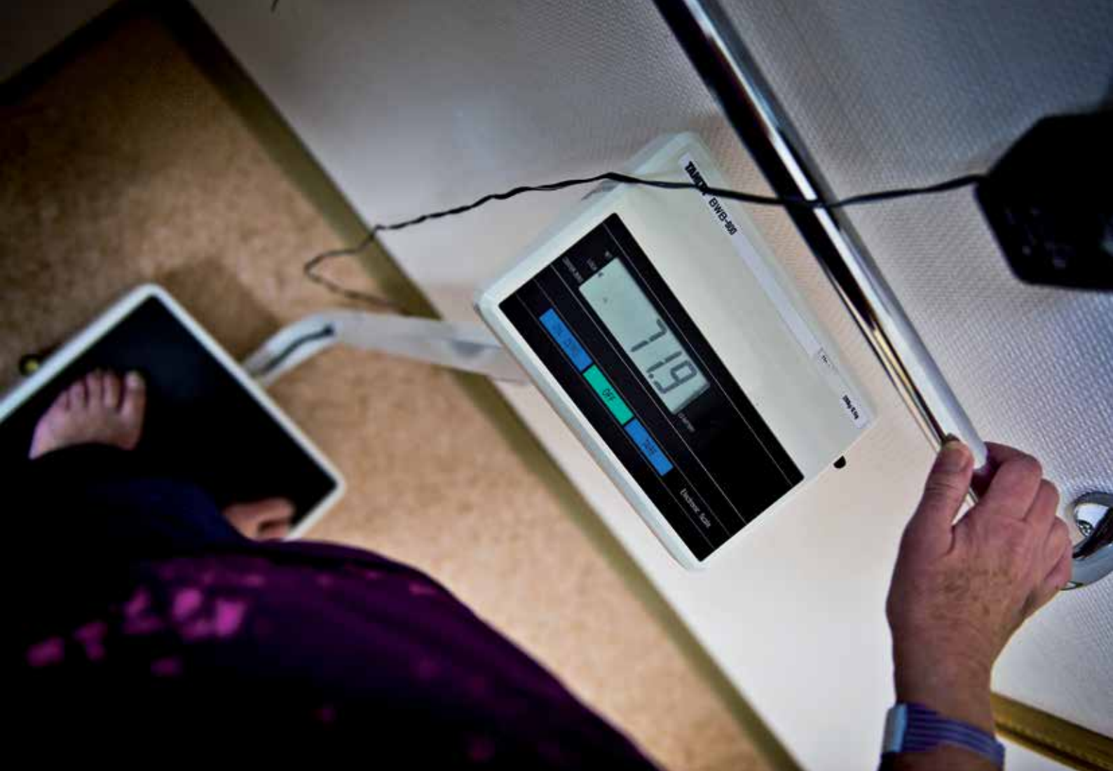
Vissa boenden har infört vägning varje måndag på väg till matsalen.

Kroppens naturliga nedbrytningsfas, katabolism, till följd av det naturliga åldrandet kommer vi inte undan. Som äldre har man också svårt att bygga upp ny muskelmassa. Men när vi dessutom blir fysiskt sjuka t ex drabbas av hjärtsvikt eller KOL, får vi inflammation i kroppen som i sin tur bryter ner våra muskler.