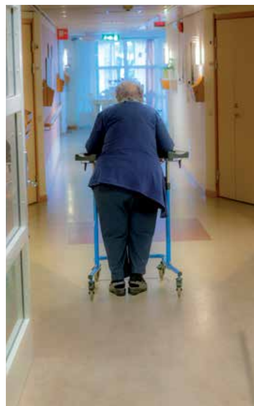
Korridorerna är rensade från prylar. Golvet ska inte vara halt.

– Det handlar ju om att öka de äldres välbefinnande.