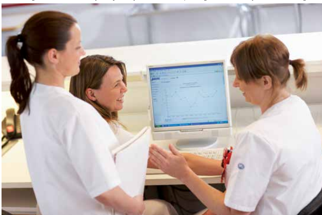
Samarbetet runt den äldre är viktigt. Det finns tydliga samband mellan kosten, munhälsa, trycksår och fall.