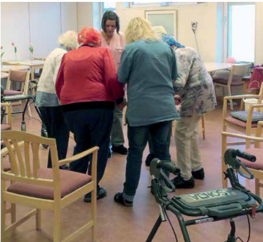
En balansträningsgrupp – en testgrupp – blev ett av resultaten när personalen inom Kramfors kommun såg att många äldres fall var en följd av försämrad balans.

Nattfastan är ett klassiskt problem inom många äldreboenden. I Kramfors såg man vid analyser att behovet